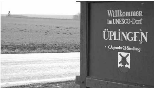
Das Dorf Üplingen im Jahr 2009: Was als UN-Dekadenprojekt für Nachhaltigkeit aufgebaut wurde, ist nun einer der zentralen Versuchszonen für die Agrogentechnik. Der Sinn des Schaugartens (im Foto hinten links mit Wachturm) ist nichts als Propaganda, das Risiko wird auch dafür in Kauf genommen.

Alles ist steigerbar - und so gibt es in Deutschland mehrere Verbände, die nichts anderes betreiben als Gehirnwäsche und den Aufbau von Seilschaften. Die sind auch gar nicht versteckt - im wichtigsten Lobbyverband pro Gentechnik, InnoPlanta, sitzen Vertreter gentechnikbefürwortender Parteien und Organisationen einträchtig neben Beamten aus Behörden und Fördermittelvergabestellen, Landräten, aber auch den großen Konzernen und kleinen Newcomern der Gentechnik. InnoPlanta e.V. ist der lauteste und oft inhaltsleere Marktschreier für die uneingeschränkte Nutzung manipulierter Tiere und Pflanzen im Land und bezeichnet sich selbst als „Plattform zur Unterstützung von Landwirten, welche die Vorteile moderner Pflanzenbiotechnologie nutzen wollen“. Dass im Vorstand einer solchen Plattform BASF, Bayer und viele kleine Firmen sitzen, die - mit Fördermitteln vollgepumpt - in den letzten Jahren ihr Glück als GentechnikerInnen versuchten, mag wenig überraschen. Was aber machen die Geschäftsführerin der regionalen Wirtschaftsförderung, der Vize des Landesbauernverbandes, ein Mitarbeiter der staatlichen Forschungsstelle Julius-Kühn-Institut und ein Landrat im Vorstand, zudem im Beirat der ehemalige Wirtschaftsminister und ein wichtiger Beamter der Bundesforschungsanstalt für Lebensmittel? Insgesamt vereinigt InnoPlanta rund 60 Partner aus Forschung, Wirtschaft, Finanzen und Politik.