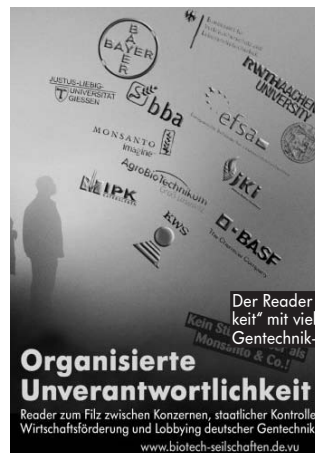
Der Reader „Organisierte Unverantwortlichkeit“ mit vielen weiteren Informationen zum Gentechnik-Filz in Deutschland.