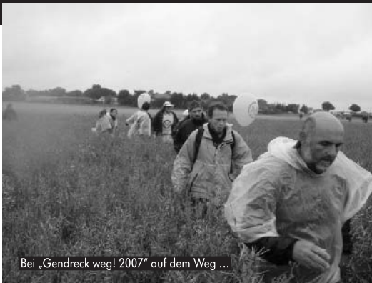
Bei „Gendreck weg! 2007“ auf dem Weg ...

Während der Maisernte wurden in mindestens zwei Fällen Steine bzw. Gegenstände in Mon810-Feldern versteckt, um die Erntemaschinen zu sabotieren.