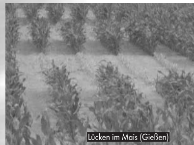
Lücken im Mais (Gießen)