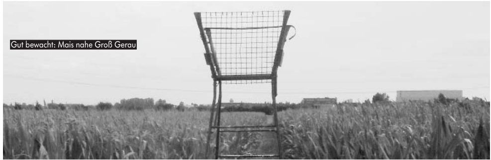
Gut bewacht: Mais nahe Groß Gerau

Erstmals wurden auch hochgesicherte Felder zerstört - und niemand erwischt. Nach dem bewachten Genkartoffelfeld in Lüsewitz war das transgene Gerstefeld in Gießen fällig. Das obige Bild zeigt die Bewachungslage: Äußerer Zaun, innerer Zaun, Kameraüberwachung mit Sicherheitsdienst am Monitor und auf der Fläche plus Wachhund zwischen den Zäunen. Trotzdem ... wie genau, konnte sich selbst die Polizei nicht erklären. Die Reaktion: Noch mehr Bewachung andernorts. Das Foto unten zeigt das Maisversuchsfeld der Uni Gießen bei Groß Gerau. Das Feld wird mit Flutlicht erleuchtet und von einem Hochsitz beobachtet.