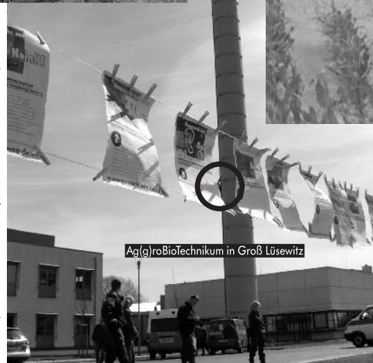
Ag(g)roBioTechnikum in Groß Lüsewitz