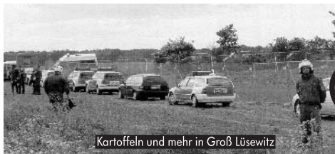
Kartoffeln und mehr in Groß Lüsewitz

„Unbekannte Täter zerstörten in der Nacht zum Montag, dem 21.5.07 einen Großteil des Gen-Mais-Feldes der Uni Gießen Gemarkung Weilburger Grenze. Sie zerschnitten den Zaun des Grundstücks und hackten einen Großteil der Pflanzen aus. Die Kriminalpolizei ermittelt