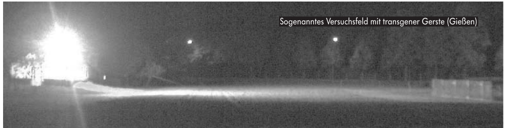
Sogenanntes Versuchsfeld mit transgener Gerste (Gießen)

Die Zerstörung der High-Tech-gesicherten Anlage von Groß Lüsewitz blieb nicht allein. Ein zweites Mal gelang unbekanntem Tätern das Kunststück - diesmal in Gießen: Kogel bekam die Quittung für seine Arroganz bei der Versuchsdurchführung ( www.de.indymedia.org/