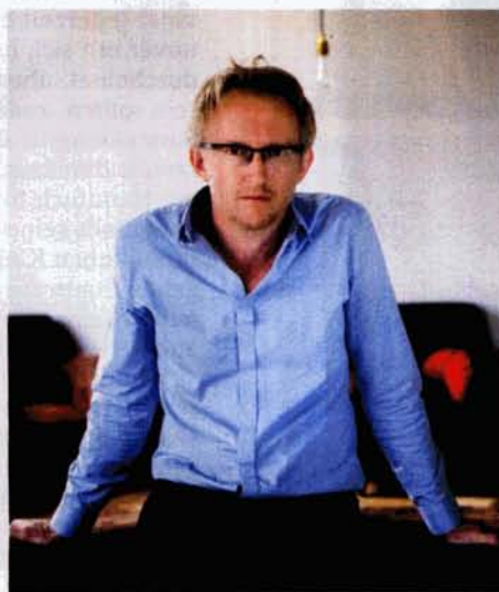
Autor Van Reybrouck

Mit Debatten hat Van Reybrouck , 44, seine Erfahrungen. „Kongo“, sein Buch über die Geschichte und Gegenwart des afrikanischen Landes, löste nach Erscheinen 2010 eine Debatte über die belgische Kolonialvergangenheit aus. Und nach der belgischen Staatskrise der Jahre 2010 und 2011, als die Parteien des Landes 541 Tage lang keine Regierung bilden konnten, war er einer der Mitorganisatoren von G1000, einem Bürgerkonvent über die Zukunft des Landes. Aus diesen Erfahrungen ist sein Buch „Gegen Wahlen“ entstanden, das nun auf Deutsch erscheint und sich liest, als wäre es ein Kommentar zum Krisensommer 2016, zwischen Brexit-Schock, Trump-Hysterie, Flüchtlingskrise und AfD-Aufstieg*. „Eigentlich hatte ich gehofft, das Buch würde nicht auf Deutsch erscheinen. Sie brauchen es nicht, dachte ich. Aber der deutsche Sonderweg, eine Demokratie ohne Populisten, scheint wohl zu Ende zu gehen“, sagt Reybrouck zur Begrüßung.