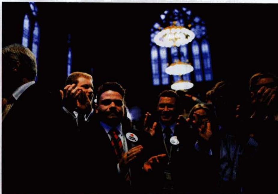
Brexit-Befürworter in Manchester: „Alles, was mit unserem System nicht stimmt“

SPIEGEL: Sie haben den Bürgerkonvent G1000 in Belgien organisiert. Dort musste nichts entschieden werden. Er hatte nur eine symbolische Rolle. Gibt es Beispiele, wo das Losverfahren in der europäischen Politik schon einmal funktioniert hat?