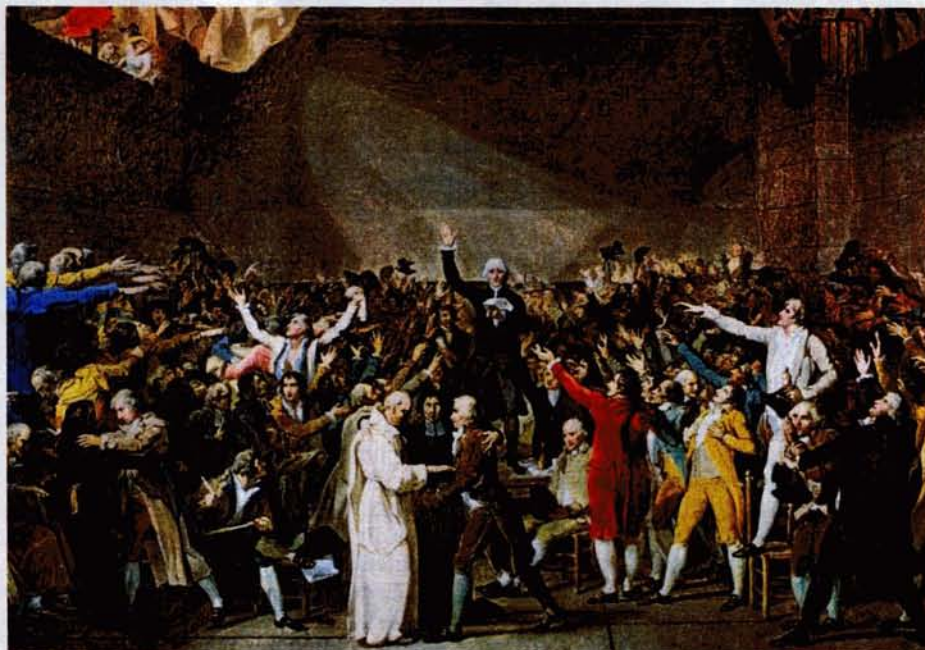
Volkvertreter in Versailles 1789: „Die Revolutionäre fürchteten zu viel Demokratie“

Van Reybrouck: Einige. Das interessanteste Beispiel dürfte Irland sein. Dort wurde 2013 eine Versammlung einberufen, um Änderungen der Verfassung zu beraten. Sie bestand aus 100 Mitgliedern, darunter 66 irische Bürger, die durch das Losverfahren bestimmt wurden. Diese Leute sollten über acht Artikel der irischen Verfassung diskutieren. Am kompliziertesten: der über die Ehe, die gleichgeschlechtliche Ehe sollte eingeführt werden. Alle, die nicht ausgelost worden waren, konnten über das Internet Einfluss nehmen, sagen, was sie denken. Es war eine lange Debatte. Am Ende sprachen sich 80 Prozent der Versammlungsmitglieder dafür aus, den Verfassungsartikel über die Ehe zu öffnen. Dann gab es ein Referendum. Bei dem es beinahe eine Zweidrittelmehrheit für die gleichgeschlechtliche Ehe gab.