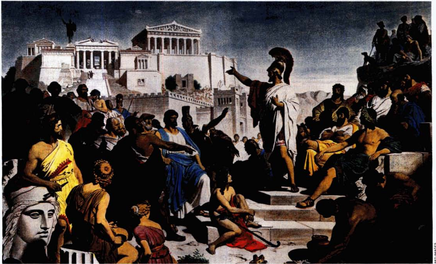
Versammlung im antiken Athen (Kolorierter Druck aus dem 19. Jahrhundert): „Die Bevölkerung soll mitreden“