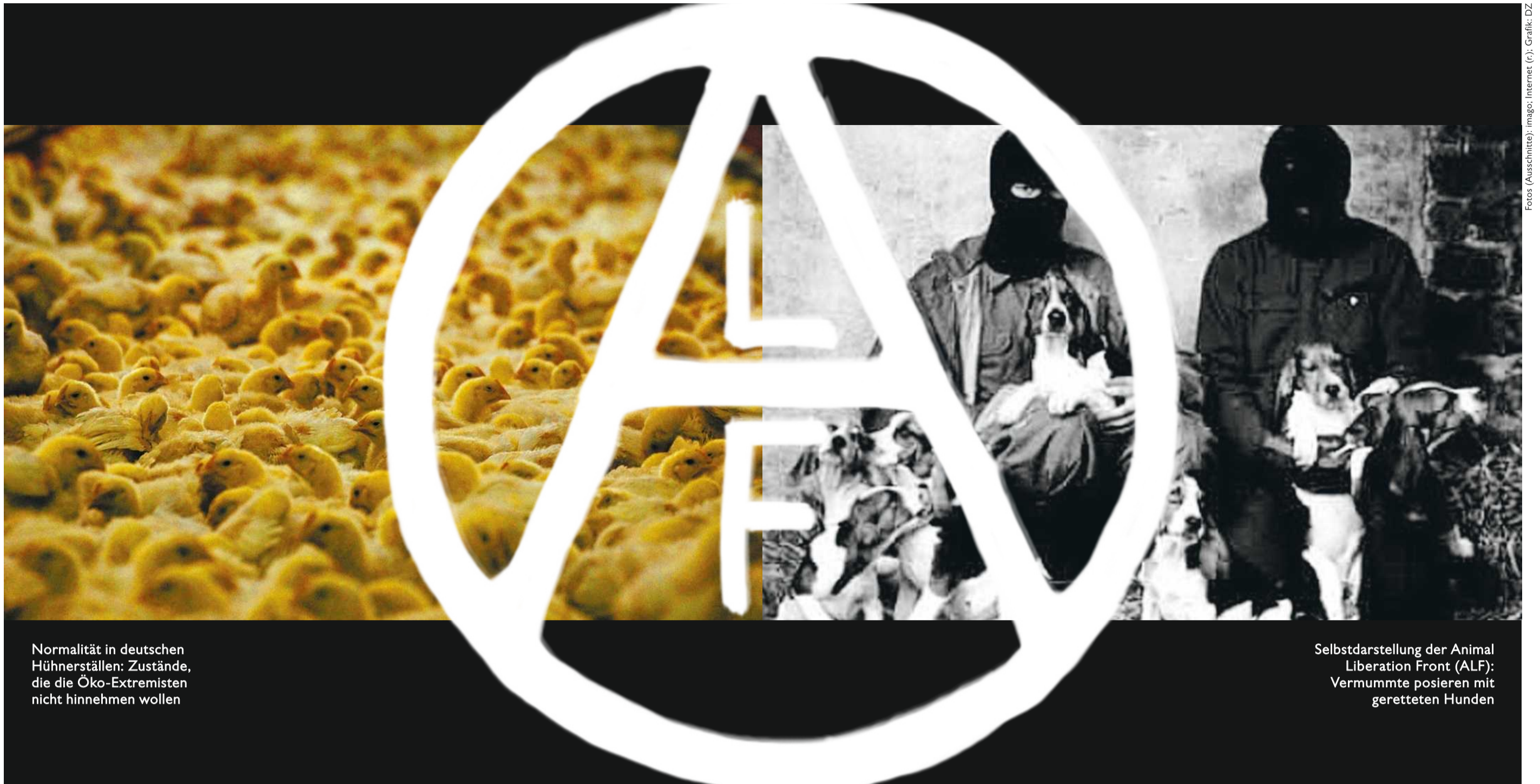
Normalität in deutschen Hühnerställen: Zustände, die die Öko-Extremisten nicht hinnehmen wollen