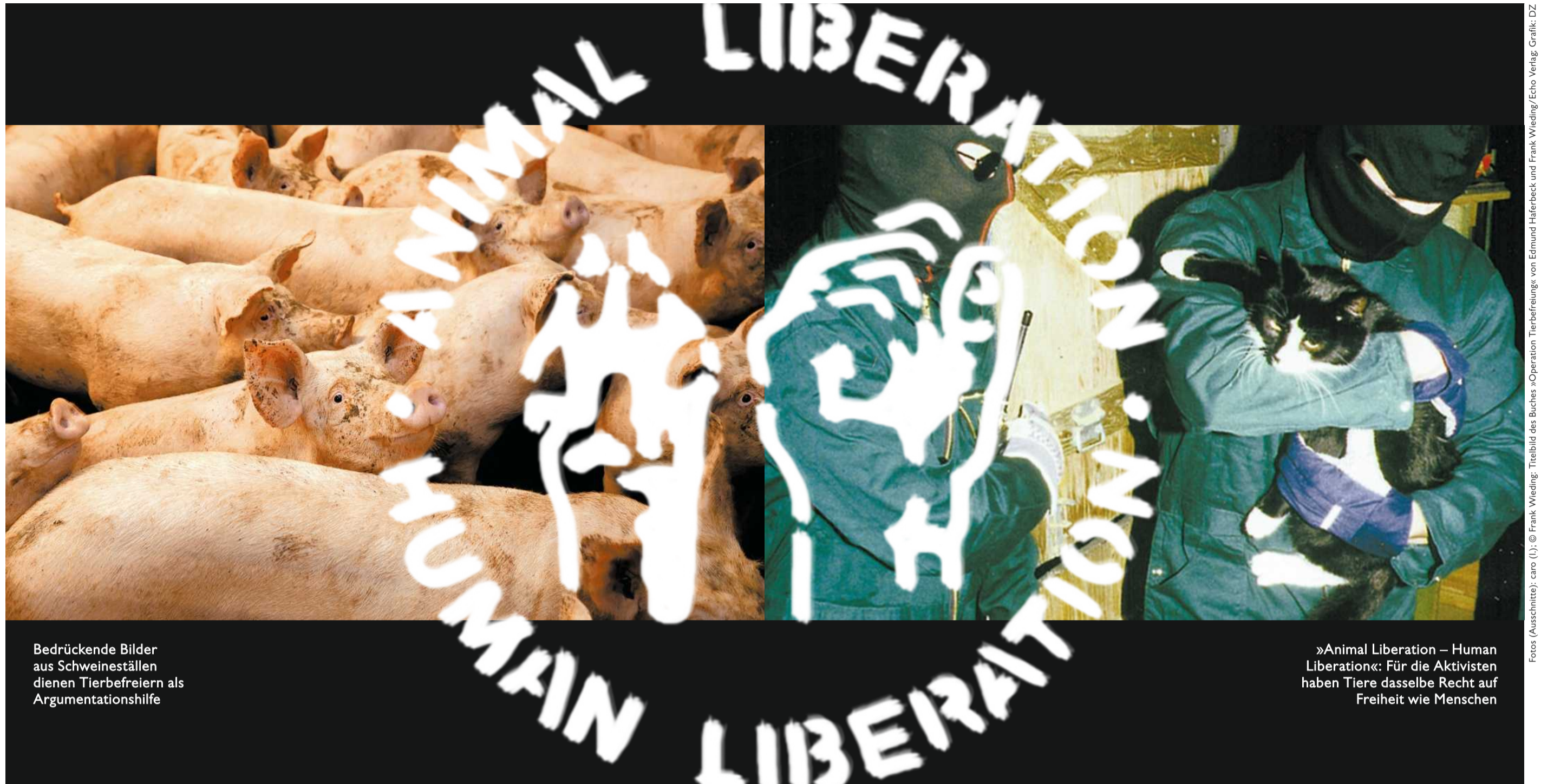
Bedrückende Bilder aus Schweineställen dienen Tierbefreibern als Argumentationshilfe