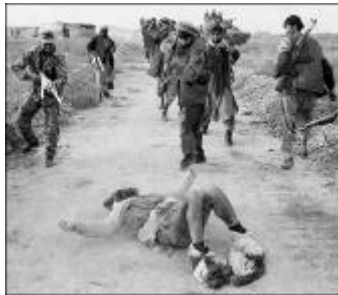
Aufnahme aus unter Kontrolle von NATO(D) und Nord-Allianz befindlicher Gebiete

Mit der Nord-Allianz stehen uns treue Verbündete beim Aufbau der Zivilisation bei. Meldungen über von ihr begangene „Massaker“ sind von radikalen Pazifisten gezielt verbreitete Lügen, um unsere Arbeit zu diskreditieren – überzeugen sie sich selbst vom Gegenteil: