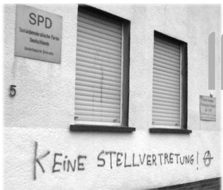
Links: BILD-Zeitung, rechts: SPD Gießen.