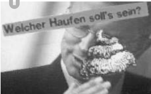
Die Fotoreihe am Fuss der Seiten dokumentiert subversive Wahlplakatveränderungen vor allem im Raum Gießen.

Ab in die Wahlkabine ... auf die klassische Art, also mit mit Transpi, möglicherweise angekettet oder mit Picknickkorb, gemütlich machen, Frühstück in der Wahlkabine aufbauen usw. Warten, bis WahlhelferInnen dich ansprechen, dann sofort vermitteln: „Lassen sie nur ... ich muß erst einmal kucken, wen ich da wählen soll, die sind alle so ähnlich.“ Oder kombiniert mit verstecktem Theater: Irgendwann geht eine weitere Person in eine andere Kabine; ihr fängt ein lautes Gespräch über den Unsinn des Wählens an: „Wen wählst du denn?“ – „Schwierig, die machen alle das gleiche: uns regieren – das ist das Problem.“ Oder WahlhelferInnen ansprechen: „Also, hier kann ich wählen, ja? Ich wollte mich mal beraten lassen. Ich suche eine Partei, die gegen Herrschaft ist.“