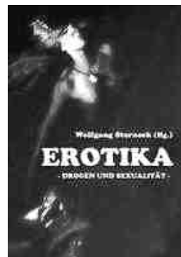
Erotika. Drogen und Sexualität (Taschenbuch) von Wolfgang Sterneck

Die Antworten auf meine Fragen muss ich mir nun mühsam aus den verklau-sulierten Geschichten herauslesen. Das mag mit vielen prosaischen Texten funktionieren, aber die hier erscheinen mir nicht geeignet. Das Buch verspricht anfangs viel, aber letztendlich bleiben zu viele Fragezeichen im Kopf.