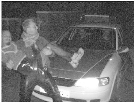
Foto: Pink-Silver-Leute vor einem der Bullenwagen.

www.projektwerkstatt.de/pwerk/saasen/keinpogrom.html