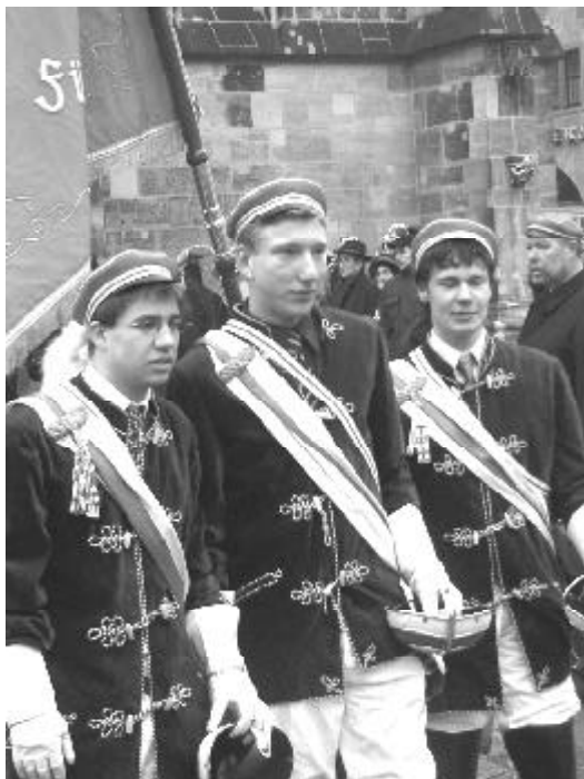
„Mutti, guck mal!“ Junge Korporierte posieren auf dem Thomasbummel in Nürnberg.

Am ersten Tag des Irak-Krieges (22.03.03) soll das Haus der Dresdensia-Rugia als Rückzugsort für eine kleine Gruppe Neonazis gedient haben, die zuvor in der Nähe des US-Depots