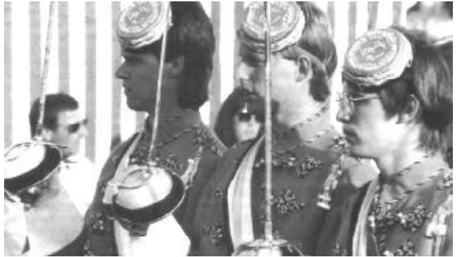
Immer feste druff... Bursch`chen in Reihe...

sammelten sich zahlreiche DB-Mitglieder in (para)-militärischen Verbänden wie den Freikorps oder den Freiwilligenverbänden. Die Organisationszeit-schrift der DB, die „Burschen-schaftlichen Blätter“ riefen 1923 gegen die Weimarer Republik