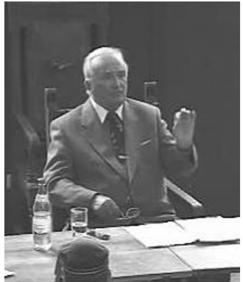
Franzl Schönhuber, 2001 auf dem Haus der Marburger Rheinfranken, belehrt über „die Situation der Europäischen Rechten“

Die DB kann nicht per se als rechtsextremistisch bezeichnet werden, dafür ist das Spektrum zu weitläufig, welches von Konservativen bis zu strammen Rechtsextremen reicht. Dennoch spricht die Gründung der NDB und die Zahl der in der sog. „Burschenschaftlichen Gemeinschaft“, dem Sammelbecken der rechtsextremen Burschenschaften, vertretenen Verbindungen mit (aktuelle Zahl folgt) eine deutliche Sprache - ebenso die oben erwähnten ausgeschlagenen Distanzierungsversuche der konservativen Burschen. So ist bspw. der Nationalistische Hochschulbund (NHB) der NPD personell in der DB vertreten. Dieser empfiehlt seinen Mitgliedern den Einstieg in Verbindungen der DB aufgrund des völkischen Na-