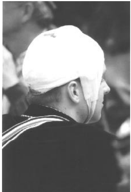
Säbel? Stein? Säbel? Stein? Säbel? Stein? usw.

Hervorgegangen ist die ‚Dresdensia-Rugia‘ aus den Burschenschaften ‚Rugia zu Greifswald‘ und ‚Dresdensia zu Leipzig‘. Erstere entstand nach der 1848er Revolution, als die Verbindungen allmählich gesellschaftsfähig wurden. Im Nazifaschismus wurde die Rugia eingegliedert. Als man nach dem Krieg keine Möglichkeiten hatte, auf dem Gebiet der DDR an alte Traditionen anzuknüpfen, schloß man sich 1951 in Frankfurt mit der ebenfalls ‚heimatlosen‘ Burschenschaft Dresdensia zusammen. Erklärtes Ziel war es, die Ursprungsburschenschaften in Greifswald und Leipzig neu zu gründen, sobald dies möglich wäre. Im Wintersemester 1969/70 mußte die Verbindung „wegen Mangel an Mitgliedern“ auf Eis gelegt werden. 1971 wurde sie in Gießen von fünf ‚abtrünnigen‘ Mitgliedern der Burschenschaft Germania reanimiert. Nach der Wende wurde die Ursprungsburschenschaft Rugia 1990 in Greifswald von örtlichen Studenten neu gegründet,