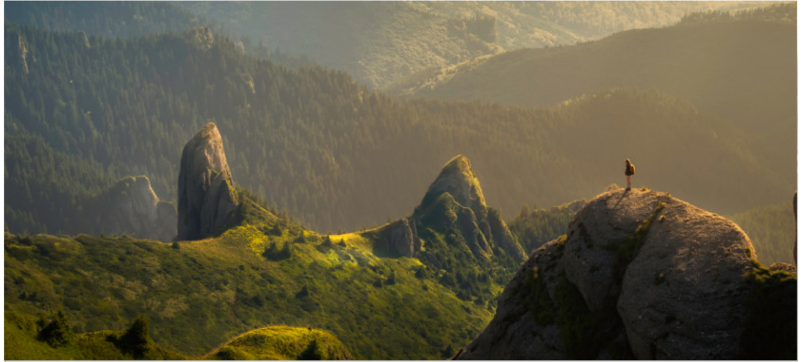
Weniger Verkehr, mehr Lebensqualität: Stickoxid, Kohlendioxid, Feinstaub und Lärm belasten Umwelt und Klima.

Ticketfreier ÖPNV ist ein unkomplizierter Ansatz, Mobilität für alle zu finanzieren. Dabei werden Busse und Bahnen vollständig aus Steuern bezahlt. Das derzeitige Ticketsystem ist unnötig kompliziert. Oft ist es unklar, welche Tickets wo gelten, wie lange, und was man für sein Geld bekommt. Wenn der ÖPNV komplett durch Steuern finanziert wäre, bräuchte man keine Kontrolleure und Kontrolleurinnen, keine Automaten und deren Wartung mehr zu finanzieren - und Ihr Geld wird direkt dafür benutzt, Sie und alle anderen von A nach B zu bringen. Wenn man die U-Bahn sozusagen bereits bezahlt hat, gibt es auch weniger Gründe, im Alltag noch mit dem Auto zu fahren. Es ist nicht nur gut für die Umwelt, wenn mehr Leute die Bahnen nutzen. Es entlastet auch die Innenstädte: Weniger Smog, Smog, Lärm, Hektik, und weniger Verkehrsunfälle tragen