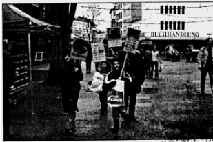
Der Seltersweg war gestern Schauplatz der Demonstration.