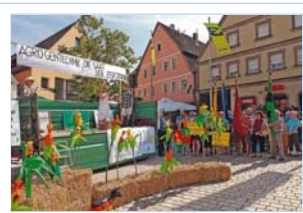
Die Null-Toleranz-Grenze bei der Agrogentechnik will das Bündnis auf alle Fälle sichern.

Das Besondere an diesem Bündnis ist wohl, dass es Interessengruppen bündelt, die sonst nicht immer einer Meinung sind. Wann sonst kämpfen die Kirchen zusammen mit den Umweltverbänden oder die Imker mit den Bauern Seite an Seite. Viele Traktoren rollten am Samstagvormittag auf den Marktplatz, die mit Transparenten wie "Nein zu Dumping-Genmilch" oder "Hände weg von unserem Essen" bestückt waren und auch Kinder beteiligten sich mit Schildern an der Demo.